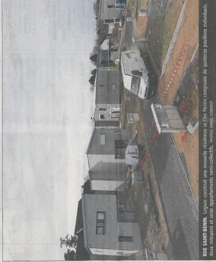
RUE SAINT-BENIN. Logivie construit une nouvelle résidence Le Clos Pessin composée de quatorze pavillons individuels, deux mitoyens et seize appartements semi-collectifs.

La livraison des logements s'effectuera en quatre tranches, de mai à juillet. Une nouvelle rue sera créée et aménagée par Logivie. Cette voie traverse le lo-