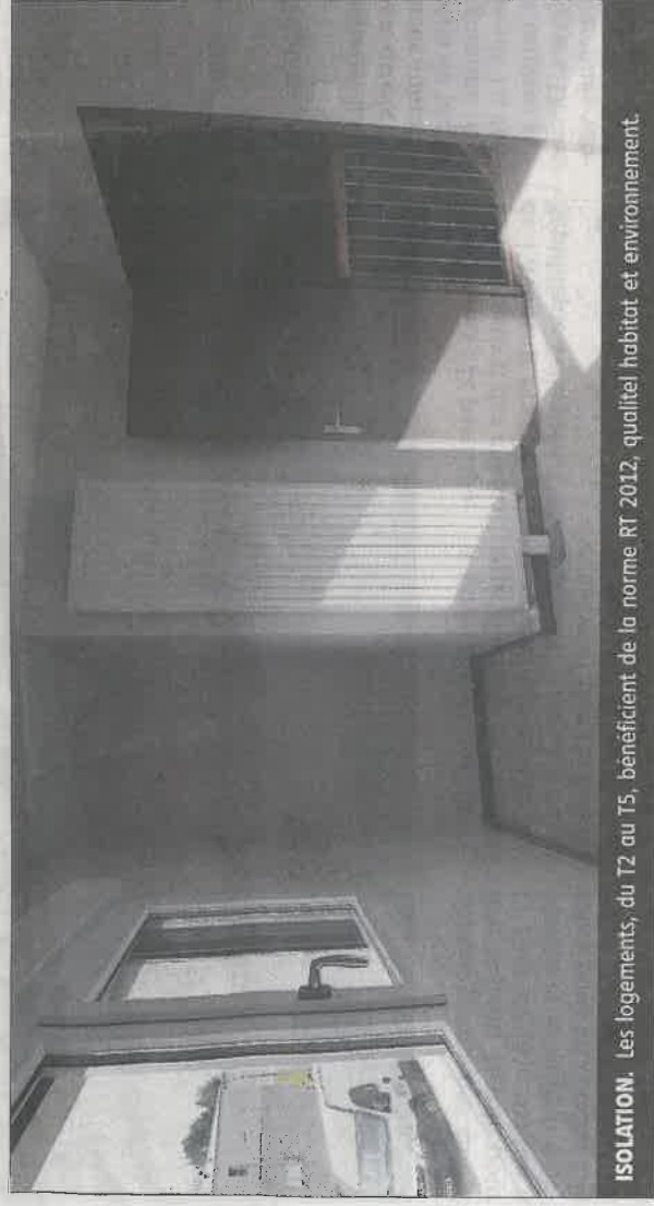
ISOLATION. Les logements, du T2 au T5, bénéficient de la norme RT 2012, qualité habitat et environnement.

➔ Logivie. 13, rue des Dodds à Nevers. 03.86.59.76.60. www.logivie.fr