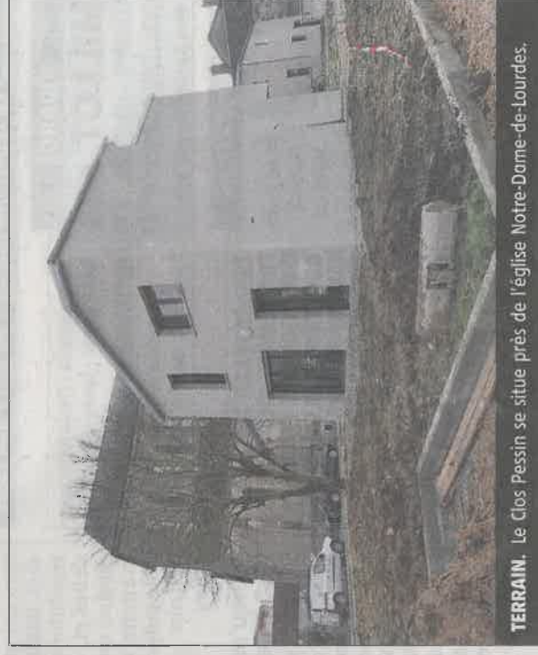
TERRAIN. Le Clos Pessin se situe près de l'église Notre-Dame-de-Lourdes.